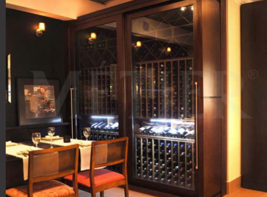
Ref. theot RP Capacidade 240 grfs Acabamento wengue Área aprox. (LAP) 320x240x65