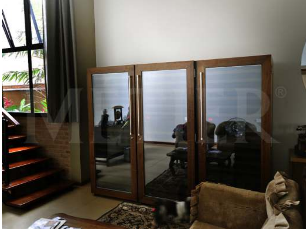
Ref. 3 un Pr200 Capacidade 600 grfs Acabamento imbuia natural Área aprox. (LAP) 240x176x70