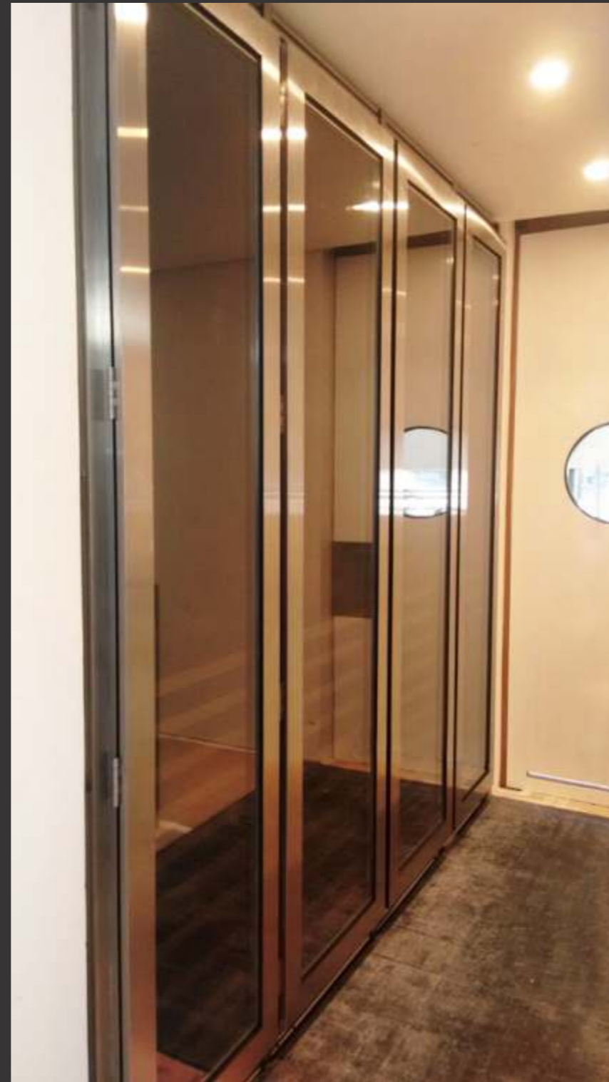
Ref. Robmar RJ Capacidade 800 grfs Acabamento inox escovado Área aprox. (LAP) 400x300x65