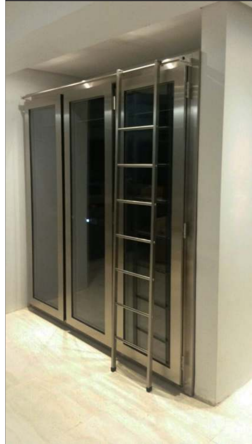
Ref. Artmogi Capacidade 600 grfs Acabamento inox escovado Área aprox. (LAP) 250x220x65