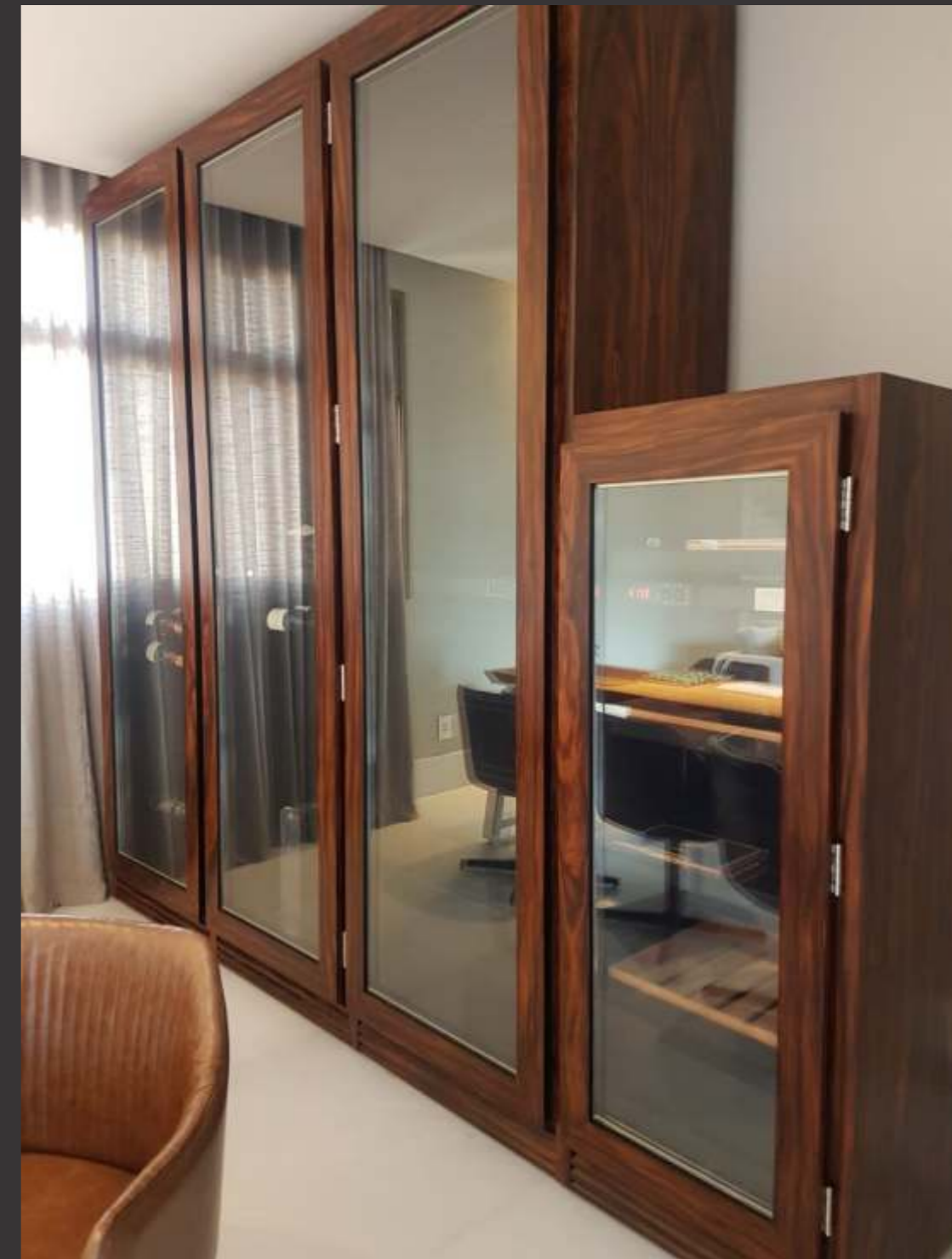
Ref. Out BH Capacidade 300 grfs + umidor Acabamento pau ferro Área aprox. (LAP) 320x240x65