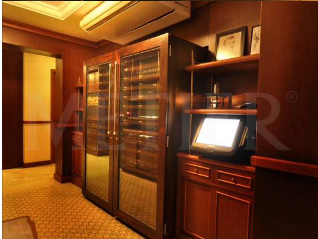
Ref. Lentrecote - elite400 Capacidade 400 grfs Acabamento imbuia Área aprox. (LAP) 160x176x70