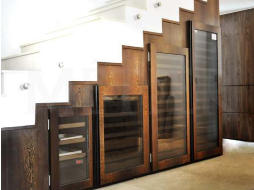
Ref. escada Capacidade 200 grfs Acabamento wengue Área aprox. (LAP) 240x176x65