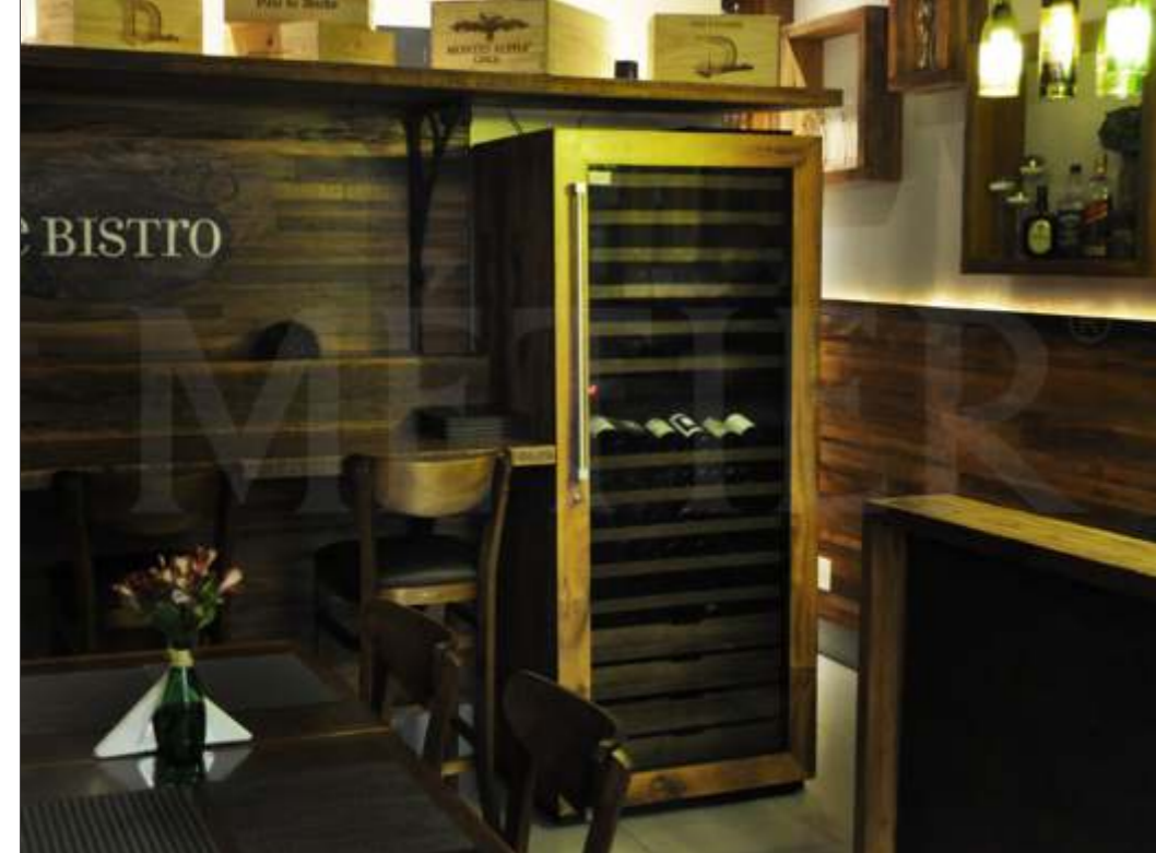
Ref. PR200 Capacidade 200 grfs Acabamento imbuia natural Área aprox. (LAP) 78x176x70