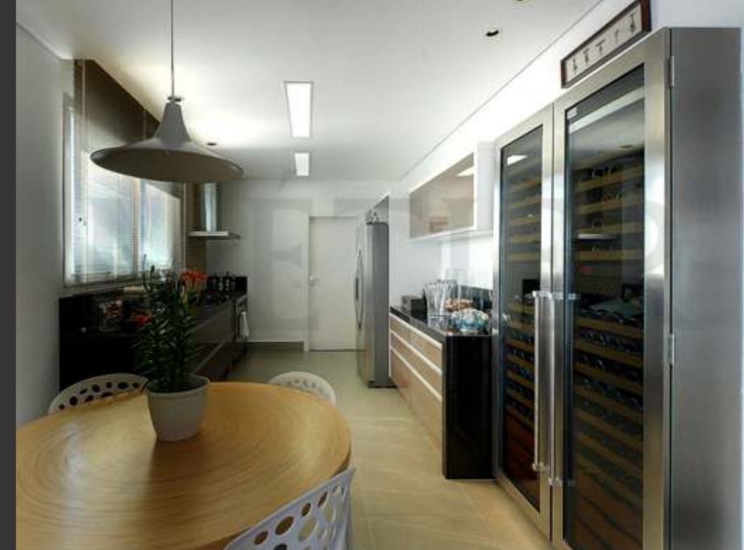
Ref. EI400 S medida Capacidade 300 grfs Acabamento imbuia Área aprox. (LAP) 160x220x65