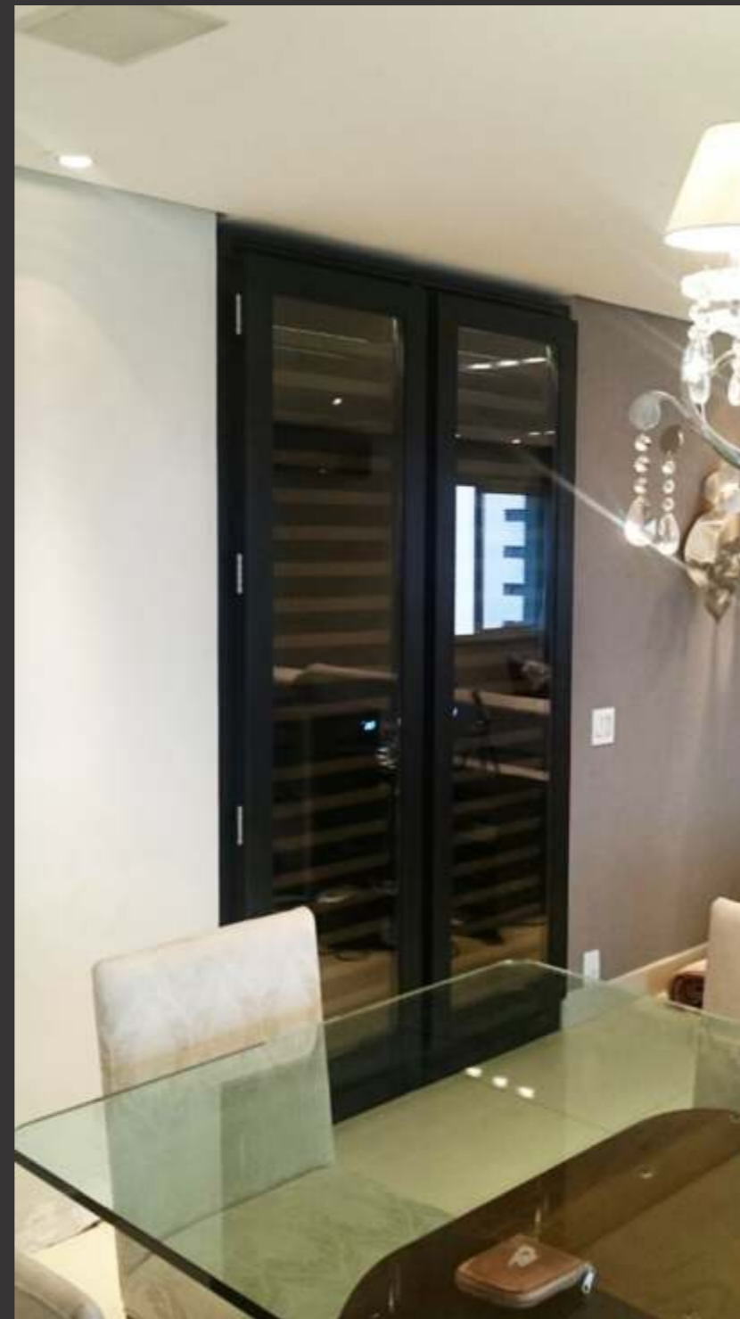
Ref. S medida SP Capacidade 500 grfs Acabamento ebanizado Área aprox. (LAP) 140x240x80