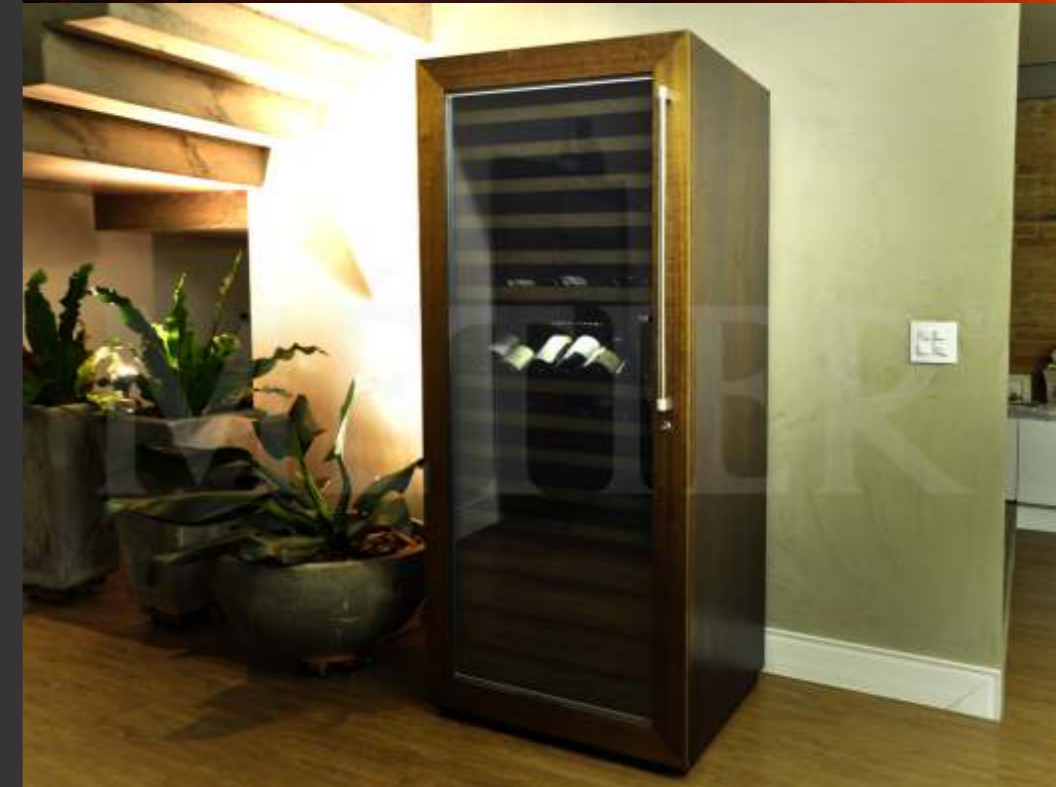
Ref. Pr200 Capacidade 200 grfs Acabamento imbuia Área aprox. (LAP) 78x176x70