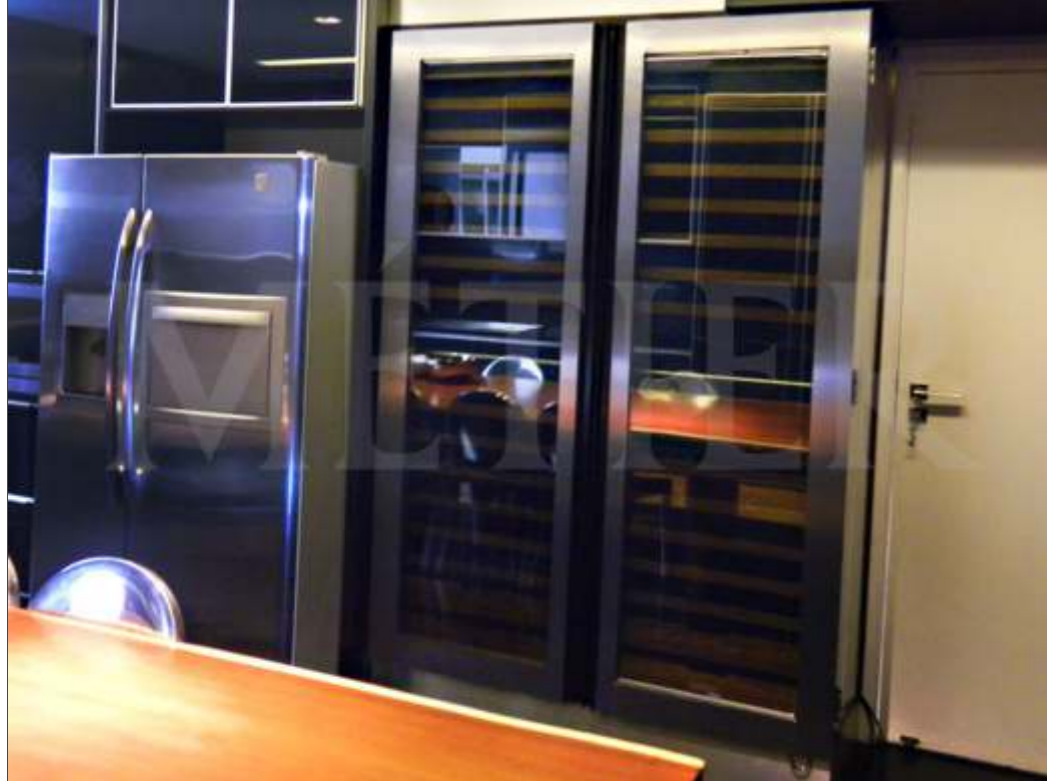
Ref. Coz RJ Capacidade 240 grfs Acabamento inox escovado Área aprox. (LAP) 130x240x65