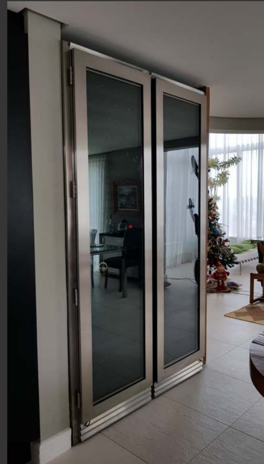
Ref. PC inox Capacidade 300 grfs Acabamento inox escovado Área aprox. (LAP) 140x240x65