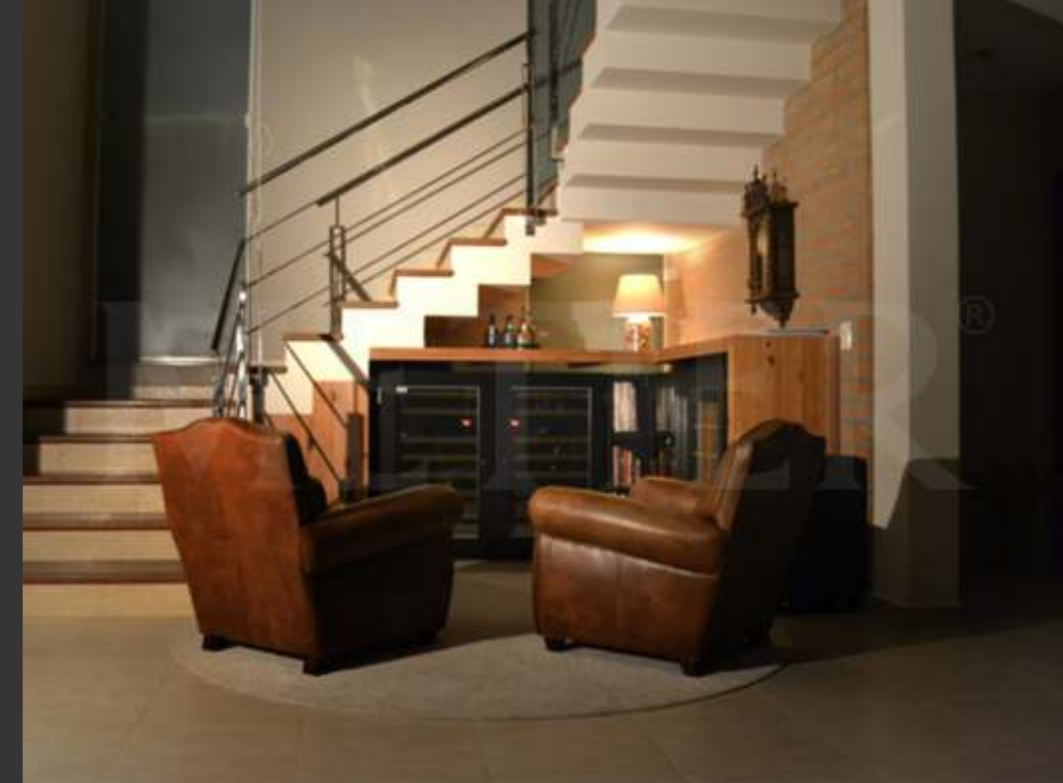
Ref. EL200 Capacidade 200 grfs Acabamento Ebanizadp Área aprox. (LAP) 130x138x70