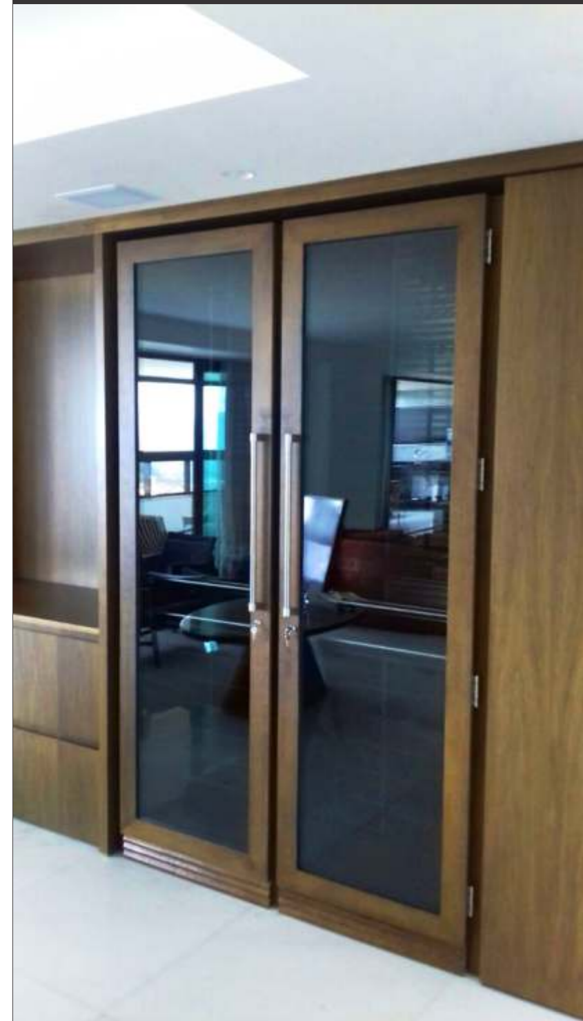
Ref. Cans BH Capacidade 280 grfs Acabamento imbuia mel Área aprox. (LAP) 160x240x65