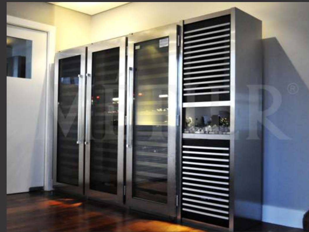
Ref. Godoi cps Capacidade 600 grfs Acabamento inox escovado Área aprox. (LAP) 240x240x80

Ref. Fla SP Capacidade 200 grfs Acabamento inox escovado Área aprox. (LAP) 250x176x65