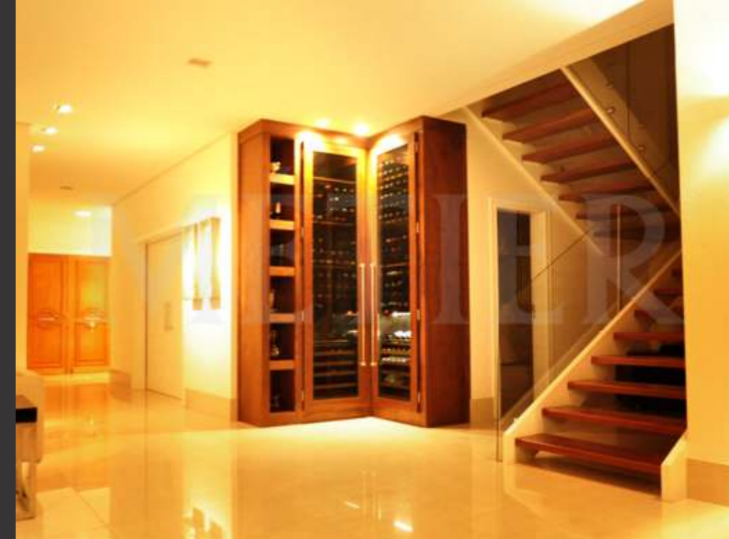
Ref. Dado cps Capacidade 180 grfs Acabamento imbuia mel Área aprox. (LAP) 150x270x65